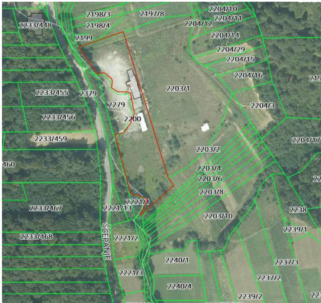
Slika: Ortofoto snimak područja nekretnina

Lokacija: Predmetna nekretnina se nalazi u Varaždinskoj županiji, u katastarskoj općini Donje Makojišće i Ščepanje